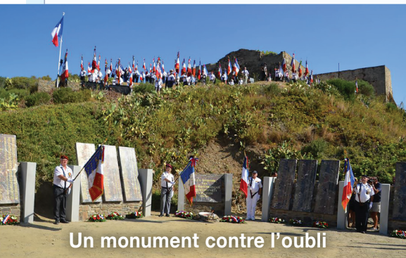
Un monument contre l'oubli