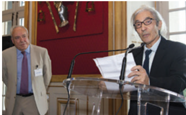
Remise du Prix Clara Lanzi à Boualem Sansal en 2018.

rie, que les propos de Ferhat Abbas : « En 1962, alors que j'étais président de l'Assemblée nationale constituante, j'ai reçu un grand nombre de diplomates étrangers... Tous étaient en admiration devant l'infrastructure et la richesse de notre pays » ( L'indépendance confisquée ).